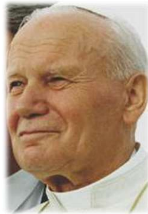
Karol Józef Wojtyła